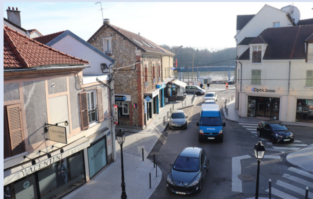
Enedis renouvelle ses câbles haute tension.

Enedis rénove ses installations électriques. Des travaux de renouvellement vont avoir lieu sur les câbles haute tension enterrés dans le centre-ville. Ils débiteront au cours du mois de mars et entraîneront des restrictions de stationnement et des fermetures ponctuelles de rues. La rue Maurice-Berteaux sera fermée les lundis 11, 18 et 25 mars. Le quai