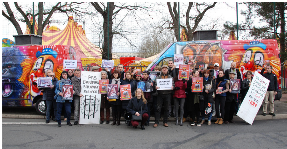
L'association Paris Animaux Zoopolis manifeste devant le cirque Lydia Zavatta.

Très motivés, les manifestants sont restés deux heures devant le cirque au moment où le public